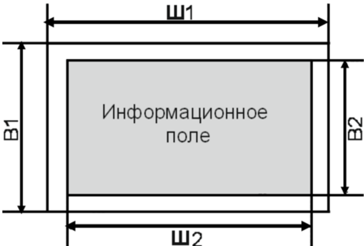
Схема рекламного изображения